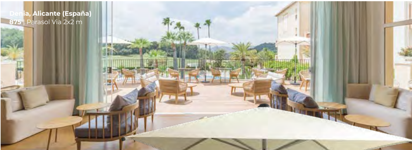
Denia, Alicante (España) 875 | Parasol Vía 2x2 m