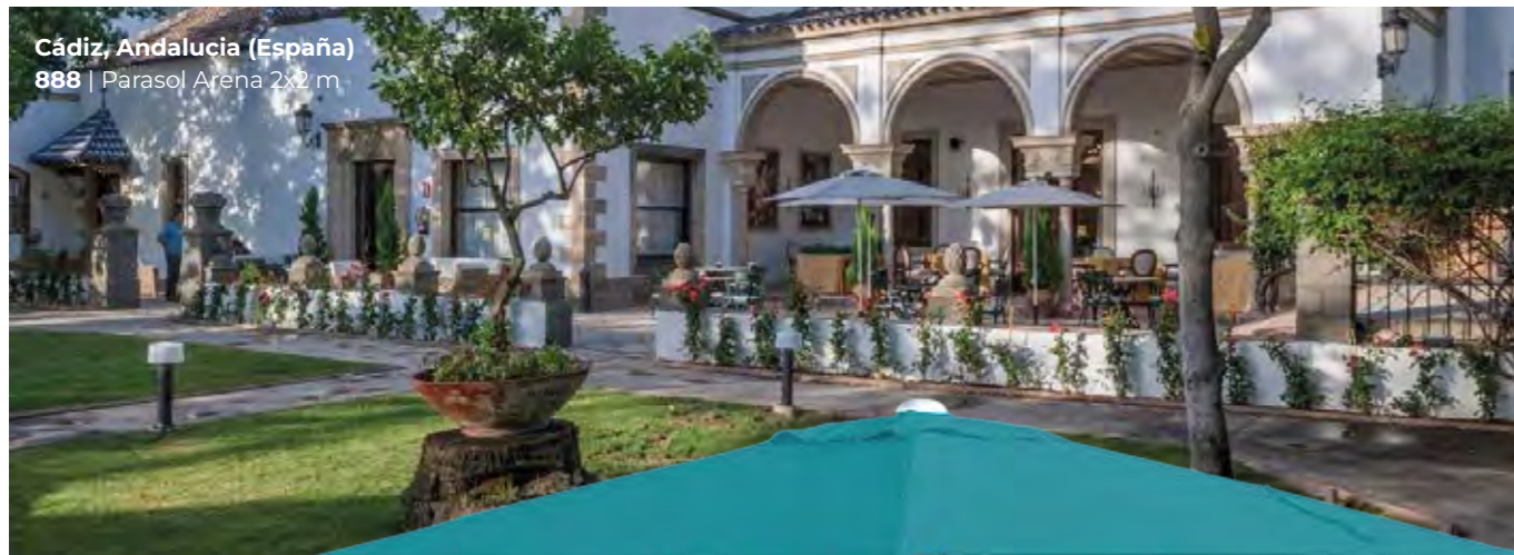
Cádiz, Andalucía (España) 888 | Parasol Arena 2x2 m