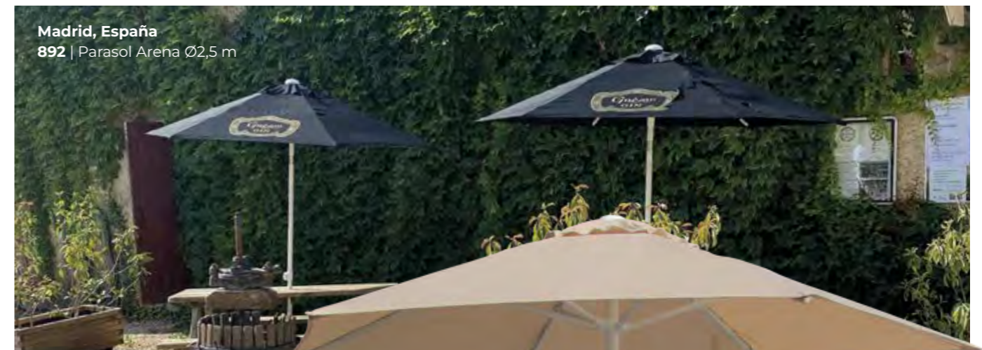
Madrid, España 892 | Parasol Arena Ø2,5 m

Mástil ocultable Concealable pole Mât coulissant